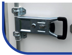
Doppelflügeltür hinten mit Drehstangenverschluss