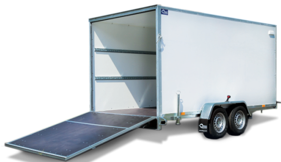
Auffahrklappe – leichte Handhabung, durch Gasdruckdämpfer unterstützt