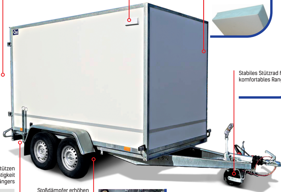
Stabiles Stützrad für komfortables Rangieren