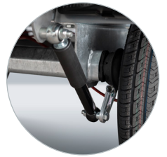
Zubehör: Achsstoßdämpfer für zusätzlichen Fahrkomfort