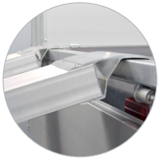
Zubehör: Universelle Aluminium Auffahrampen

Ein KLT-Pro als Basis reicht völlig aus, aber manchmal möchte man ein wenig mehr Laderaum oder Komfort. Hierfür hat Anssems verschiedene Zubehöerteile im Programm. Je nachdem was Sie transportieren möchten, können Sie Ihren Anssems KLT-Pro mit zahlreichen Zubehörmöglichkeiten individualisieren und für Ihre Zwecke optimieren.